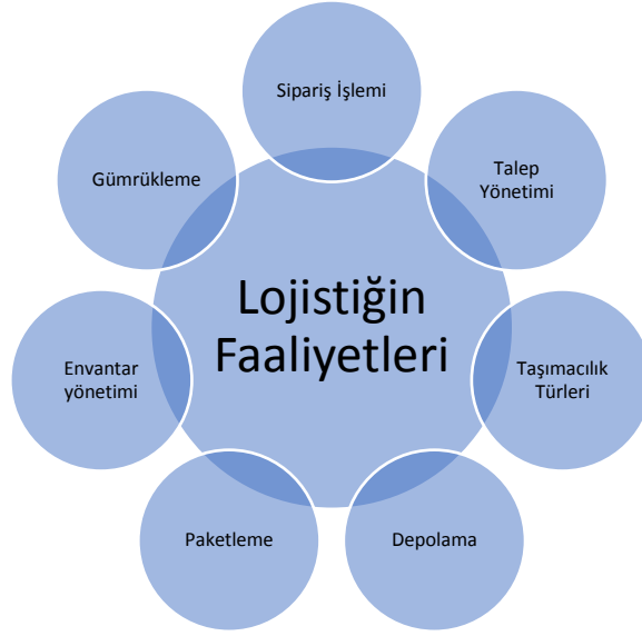
Şekil 1. Lojistiğin Faaliyetleri