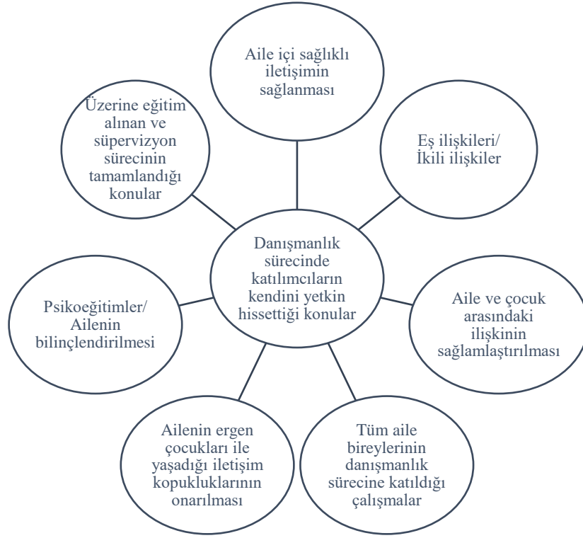
Şekil 4.1. Katılımcıların danışmanlık sürecinde kendini yetkin hissettiği konular

Bunun yanı sıra Şekil 4.1. incelendiğinde araştırmaya katılan aile danışmanlarının yetkinlik konusunda eğitim ve süpervizyona verdiği önemin fazla olduğu görülmüştür. Ailenin öyküsünü aldıktan ve genogramını çıkardıktan sonra danışmanlar kişiler arası problemlerin çözümüne katkı sağlamaktadır.